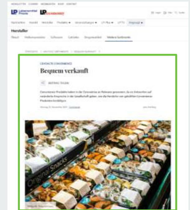
Landingpage: Spezifikationen auf Anfrage

Verlinkung auf Landingpage mit kundenindividuellen Produktinformationen im redaktionellen Layout der Site: